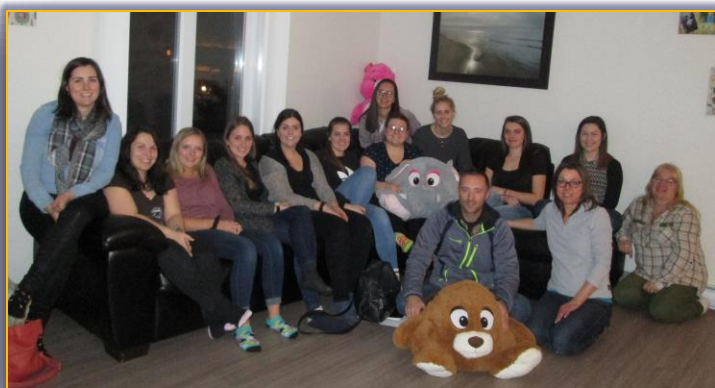
ÉQUIPE DE LA BEAUCE